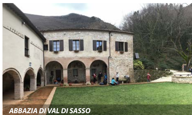
ABBAZIA DI VAL DI SASSO