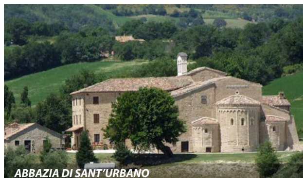
ABBAZIA DI SANT'URBANO