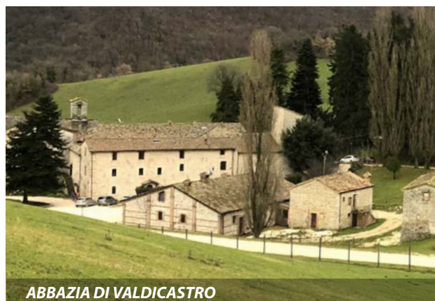
ABBAZIA DI VALDICASTRO