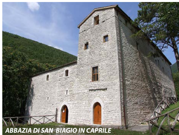
ABBAZIA DI SAN BIAGIO IN CAPRILE